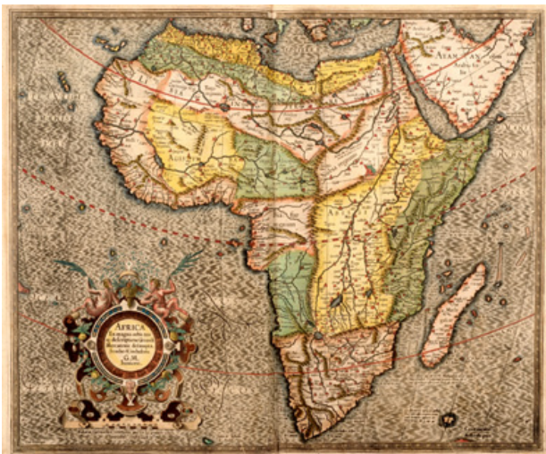
Afrika van Gerard Mercator Junior versus Afrika van Blaeu (zie volgende pagina)